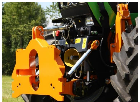
Starrer Anbau mit Achsabstützung