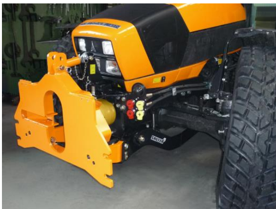
Kommunalsatz mit SDF-FKH