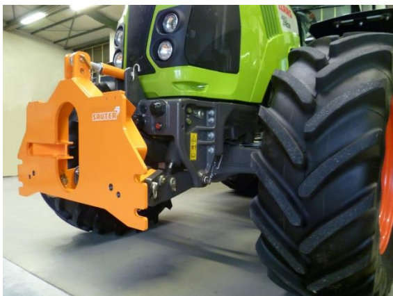
Kommunalsatz mit Claas-FKH