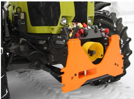
Festanbau mit Achsabstützung