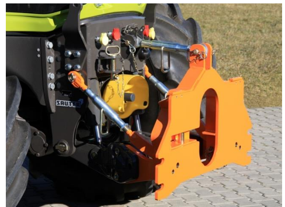
Starrer Anbau mit Sauter-FKH